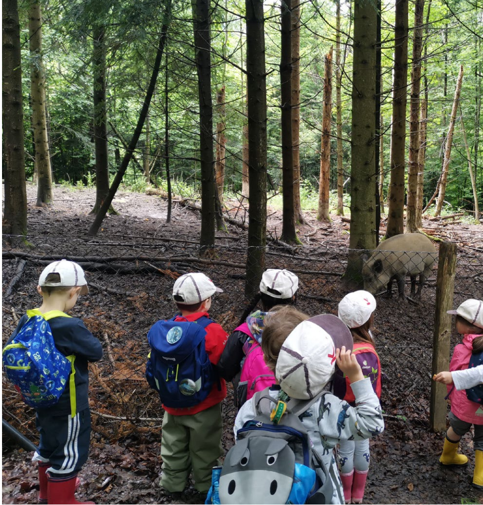
Ausflug Wildpark Langnau-Schwerzi